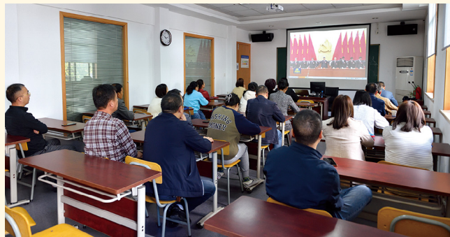
2022年10月18日，新昌制药厂后勤第二党支部党员大会，观看二十大开幕式视频。