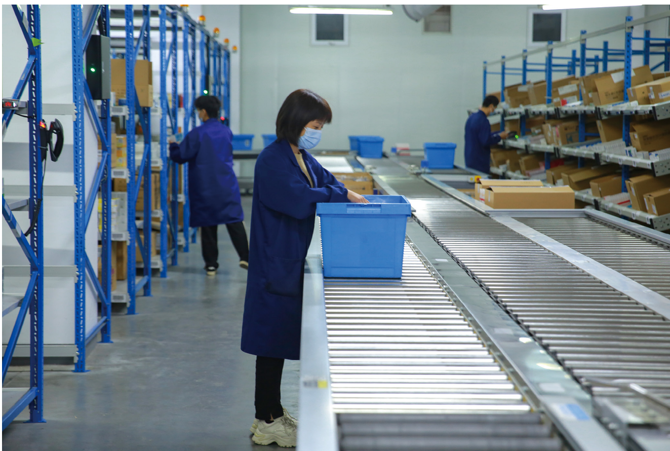
仓储部配发药品。