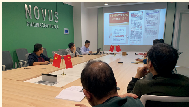
2022年11月2日，创新生物第一党支部学习二十大精神。