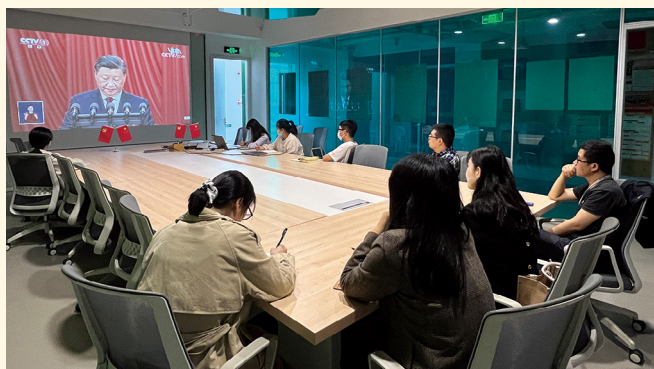
2022年10月16日，创新生物党总支组织部分党员收看二十大开幕会直播。