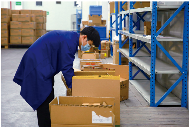
质管部验收药品。