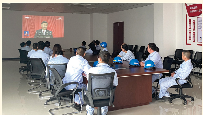
2022年10月16日，昌海生物第三党支部组织收看二十大开幕会直播。