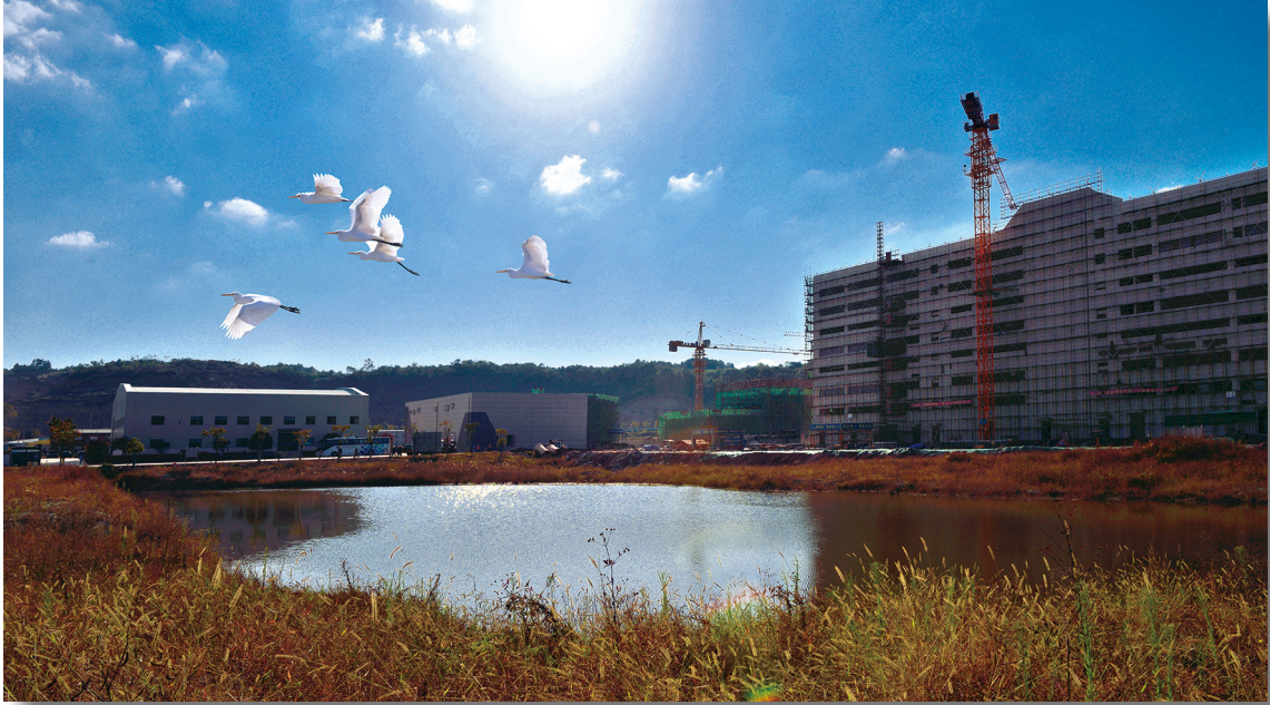
员工艺萃 摄影作品《和谐生态 绿色发展》