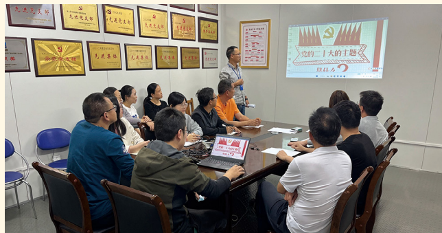
2022年10月26日，新昌制药厂制剂分厂设备科“班前十分钟”，学习二十大报告。