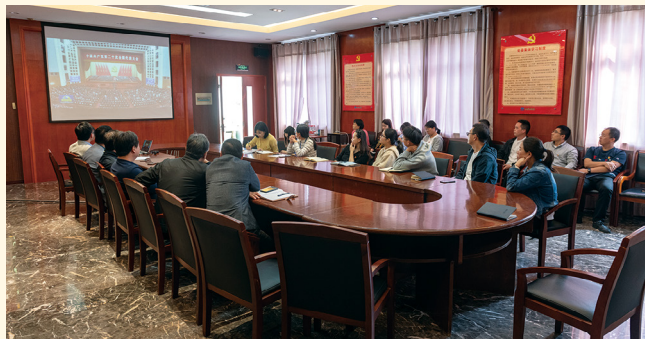
2022年10月17日，新昌制药厂后勤第一党支部党员大会，观看二十大开幕式盛况。