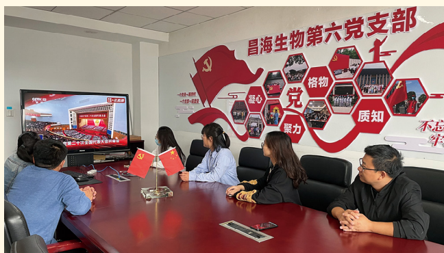
2022年10月16日，昌海生物第六党支部组织收看二十大开幕会直播。李晓英 摄