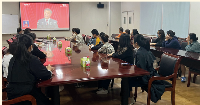
2022年10月16日，新昌制药厂质管部第一党支部组织党员收看二十大开幕式直播。