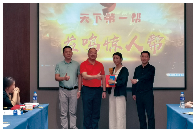
颁发“天下第一帮”奖。