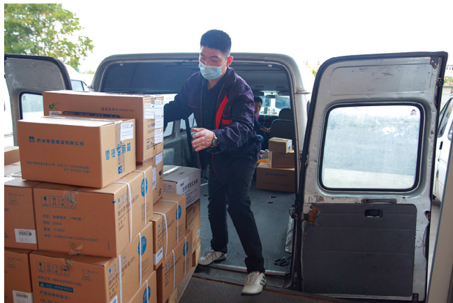
运输组装运药品。