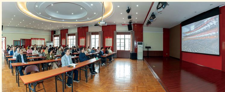
2022年10月16日，新昌制药厂党委组织党、工、团的代表等收看二十大开幕式直播。