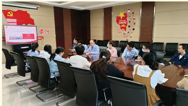
2022年11月2日，昌海制药第一党支部学习二十大报告感想分享交流。赵亚琼 摄