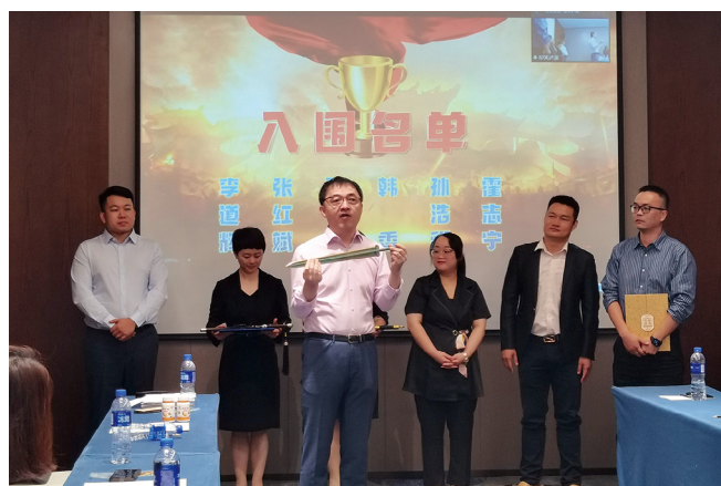
颁发“真心英雄”奖。