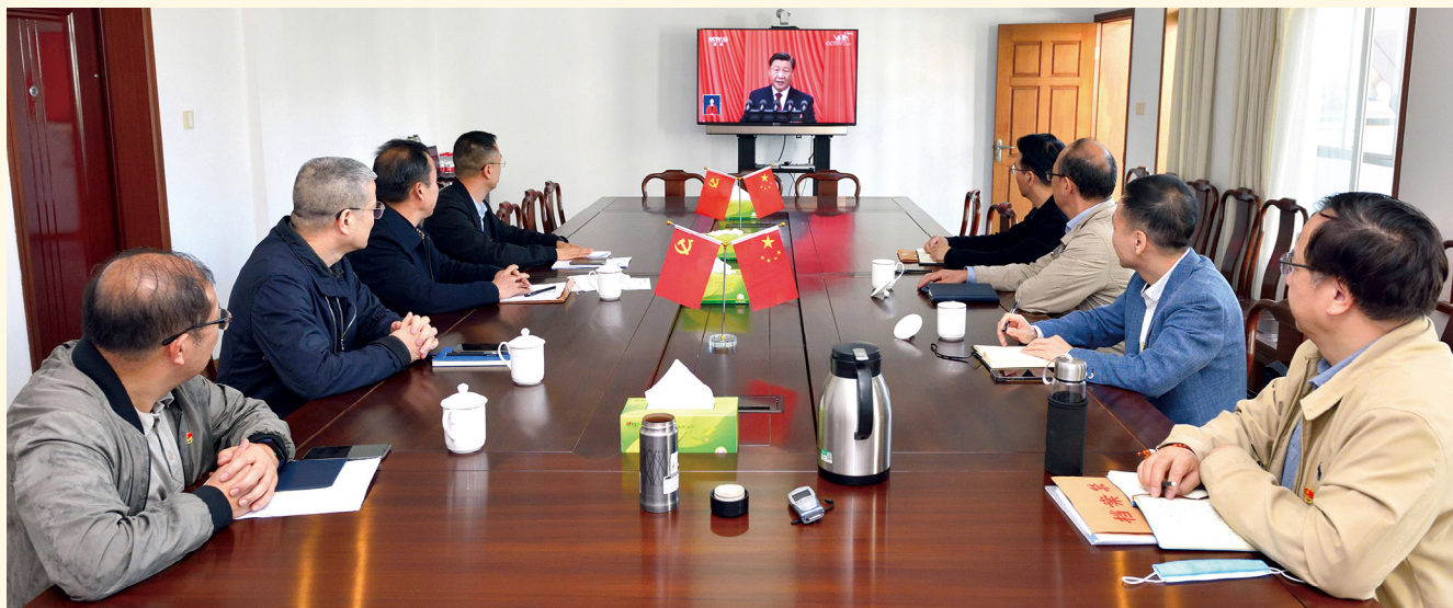
2022年10月21日，浙江医药党委专题学习二十大精神。