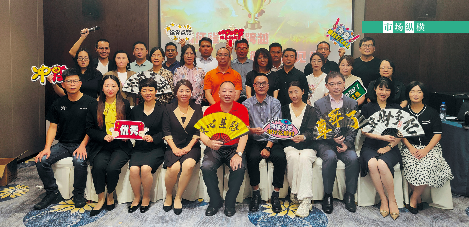
“来益英雄大会”合影。