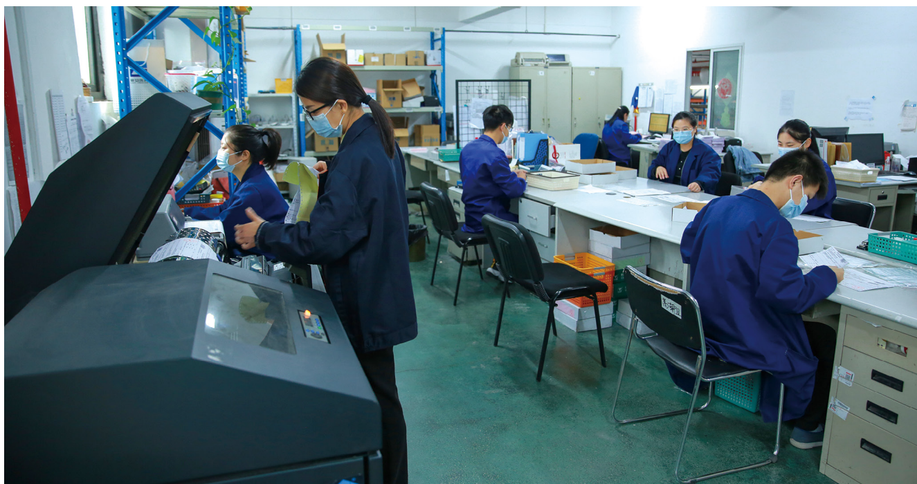
联络组打印、整理、复核票据。