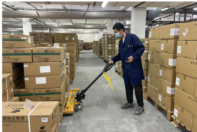
仓库搬运药品。