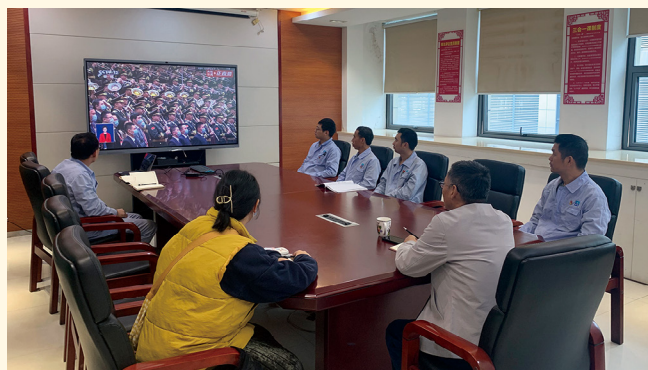
2022年10月16日，昌海生物第一、第二党支部组织收看二十大开幕会直播。