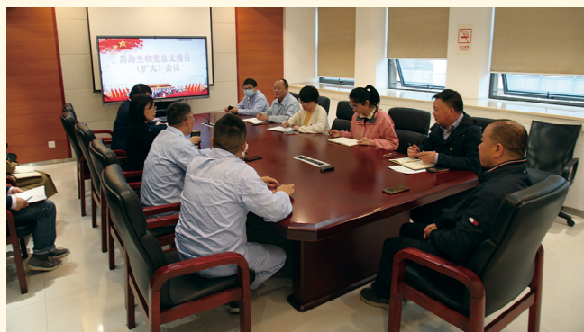
2022年10月28日，昌海生物党总支委员（扩大）会议，部署学习宣传贯彻二十大精神。