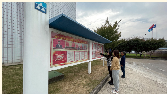
新昌制药厂厂区宣传窗张贴的二十大主题宣传展板。