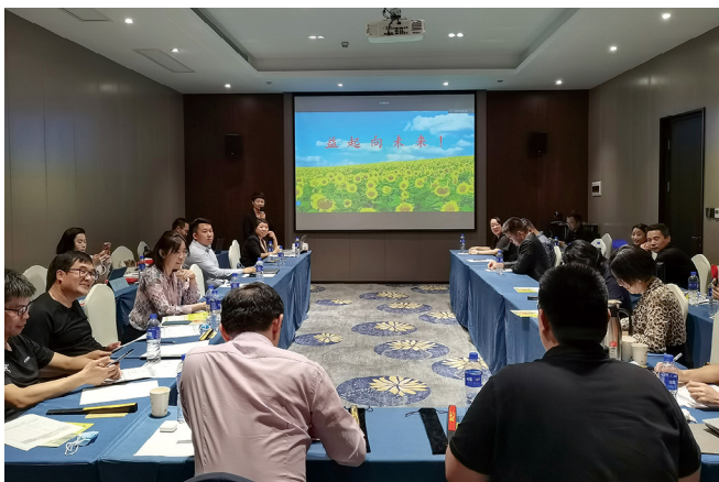
总决赛现场。

此外，各门派祭出一名“大魔王”上场助阵，以自由演讲形式为本门“补刀”，增加总积分。分别是：