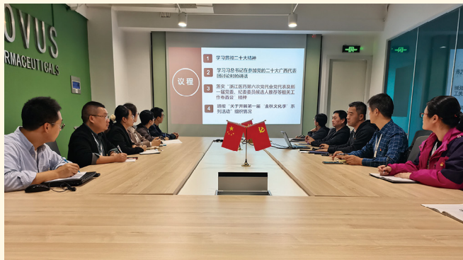
2022年10月28日，创新生物党总支学习二十大精神。