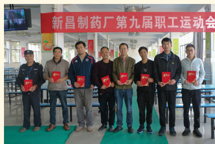
中国象棋比赛获奖人员