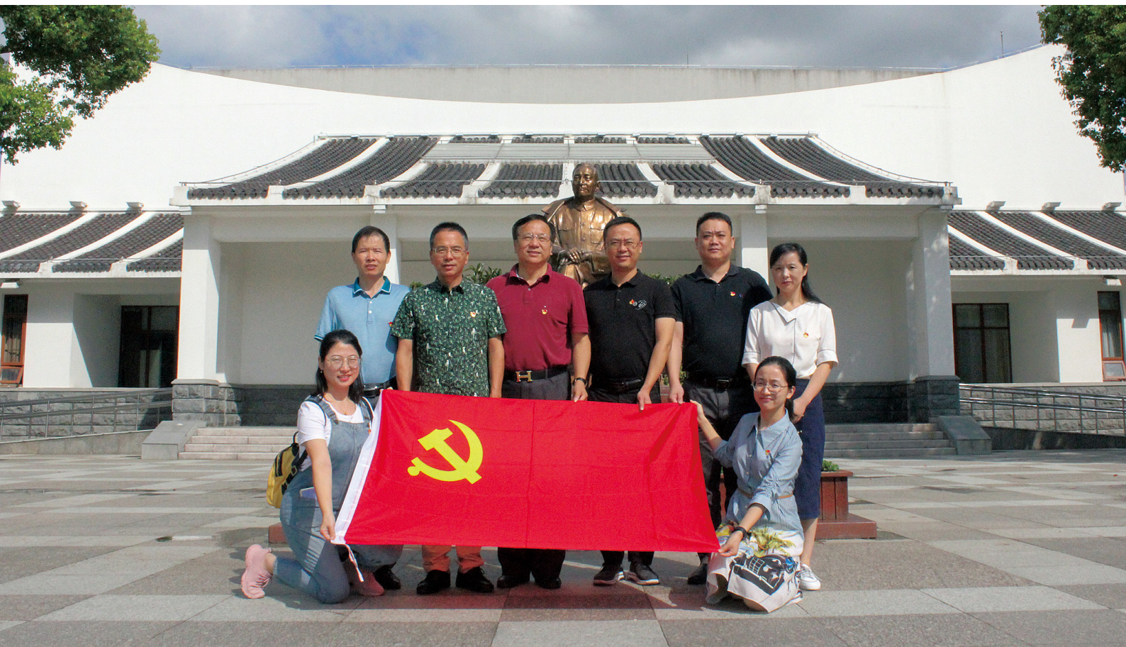
在陈云纪念馆前合影留念