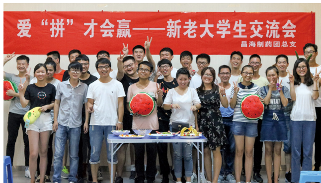
车间员工参加新老大学生交流会。