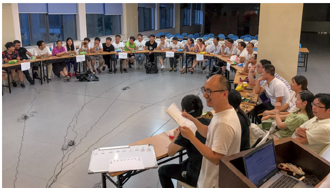
车间员工参加安全知识竞赛。