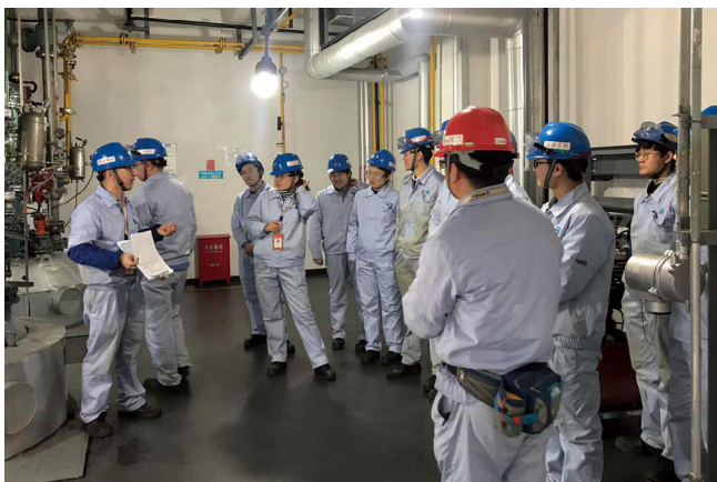
班组安全培训。