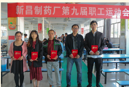
围棋比赛获奖人员