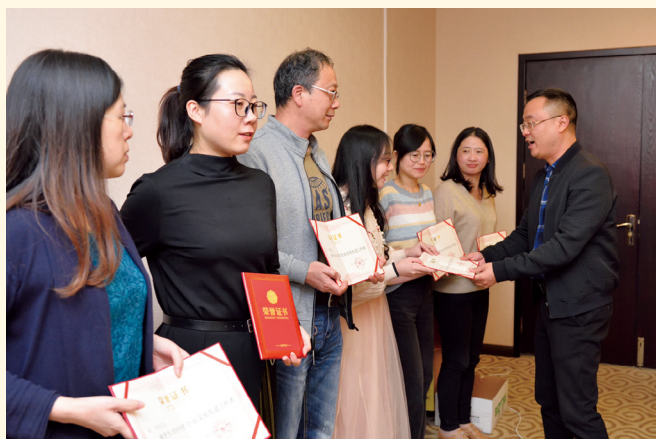
2018年度企业文化先进工作者颁奖仪式