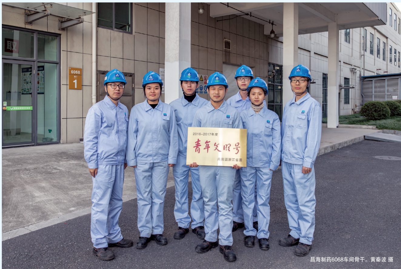
昌海制药6068车间骨干。黄秦波 摄