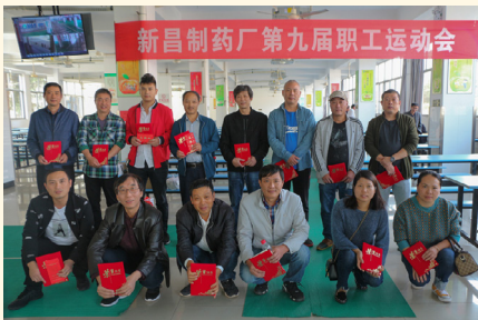
长红心比赛获奖人员