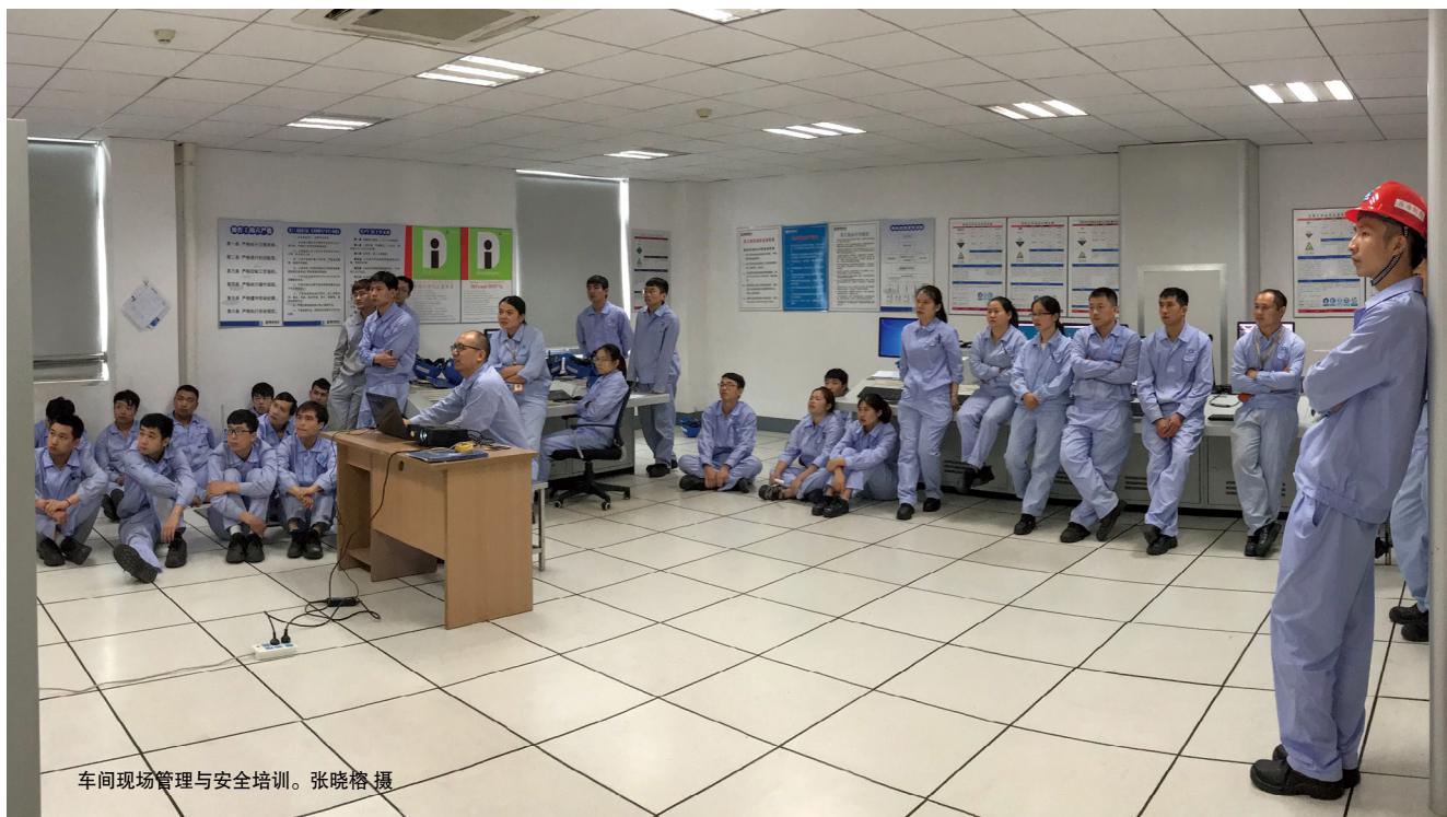
车间现场管理与安全培训。

安全意识的树立，关键在于平时的点滴培育，陈龙为了让每一个员工树立安全理念，履行安全职责，以及提高安全