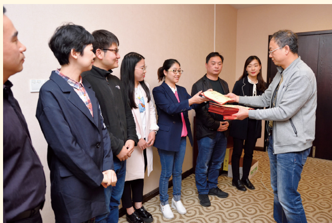
2018年度优秀通联工作者颁奖仪式