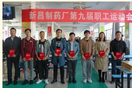
五子棋比赛获奖人员